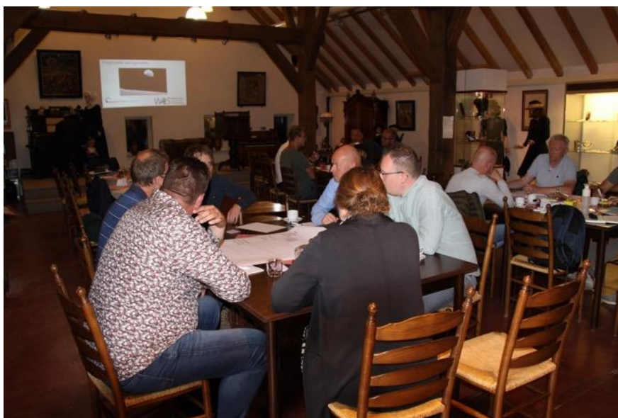
Foto workshop juni 2023